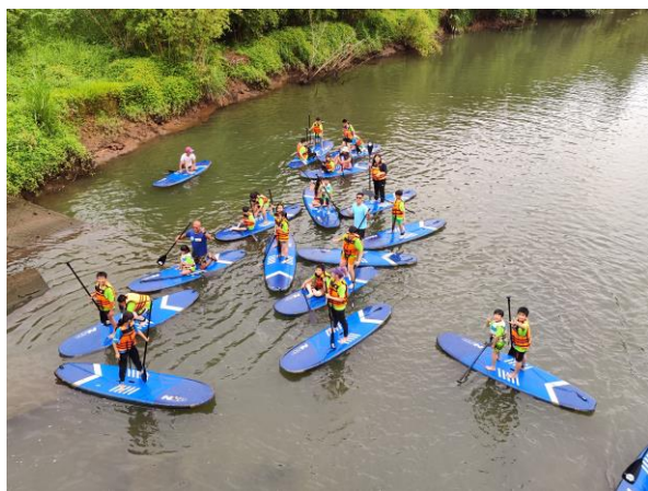
大鵬國小辦理 sup 立槳，學生開心的練習 站立划船