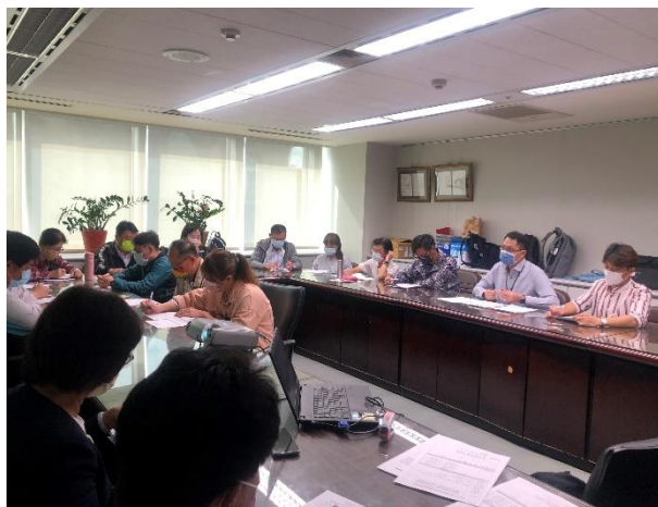
學生體驗活動種子學校會議