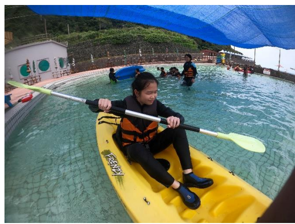
學生參加獨木舟活動，在水池中進行練習操 槳