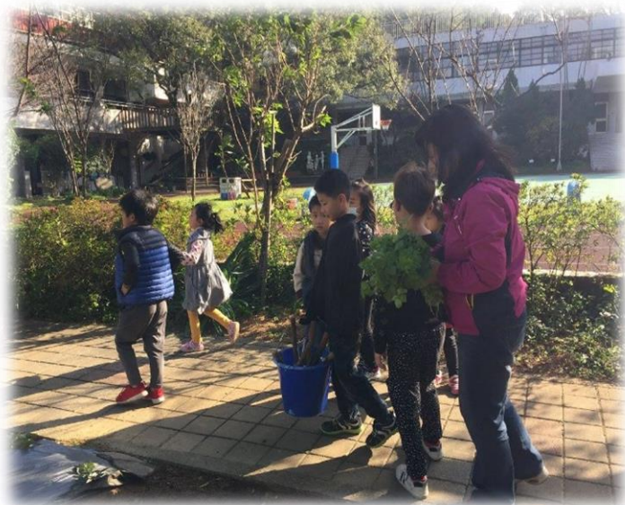
興華小農園－ 食農小尖兵出發了！