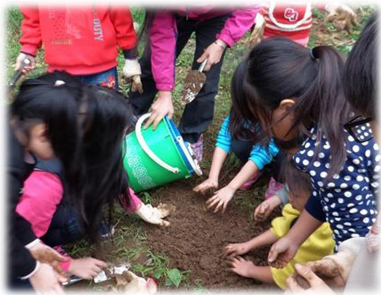
興華小農園－ 埋下希望的種子！