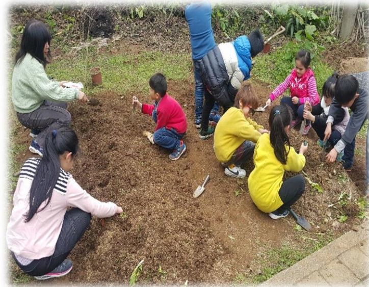
興華小農園－ 實際體驗整地與鬆土