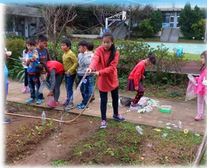
興華小農園－ 澆水灌溉、期待收成！