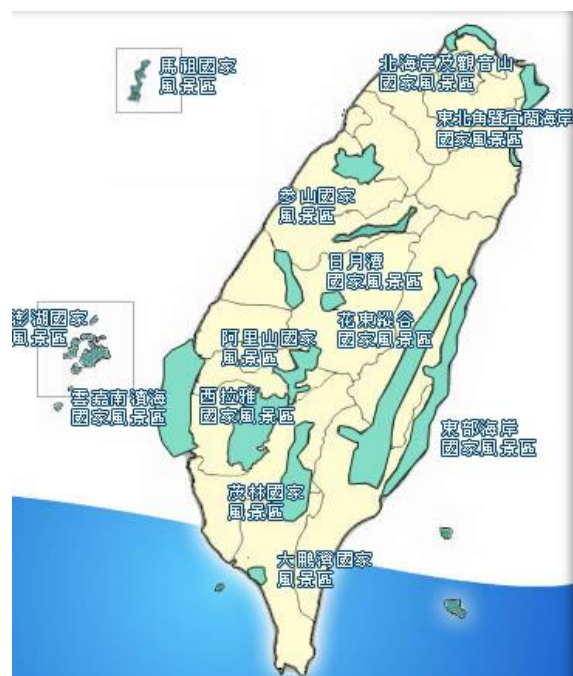
圖一 臺灣的十三處國家風景區

北海岸及觀音山國家風景區 --成立於 2002 年，包含「北海岸風景區」、「野柳風景區」與觀音山，北海岸及觀音山國家風景區。重要景點有富基漁港、富貴角、石門洞、野柳豆腐岩、金山老街、女王頭等，野柳風景區以特殊地質、地形為其特色。2014 年增加基隆市的外木山、情人湖、和平島等景點。