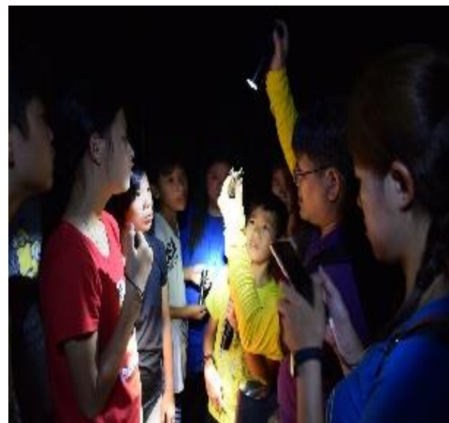
說明：夜觀青蛙與響應護蛙避免陸殺行動