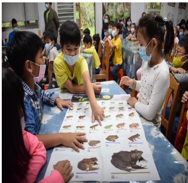
說明：認識青蛙種類及其生態環境需求。