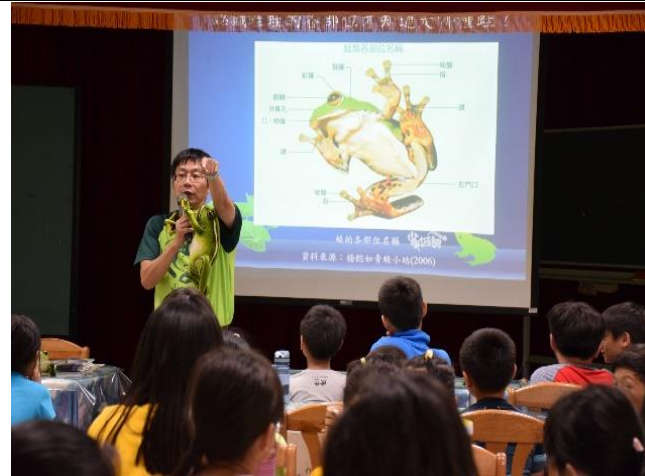
說明：邀請三峽蛙蛙國專家到校講座。