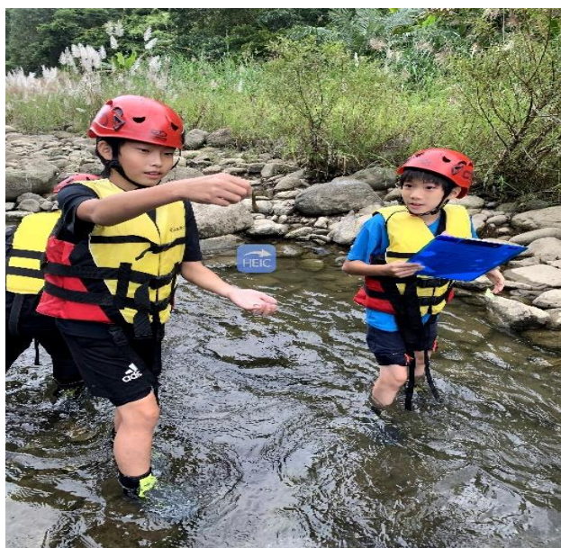
說明：實地到大豹溪進行青蛙生態調查。