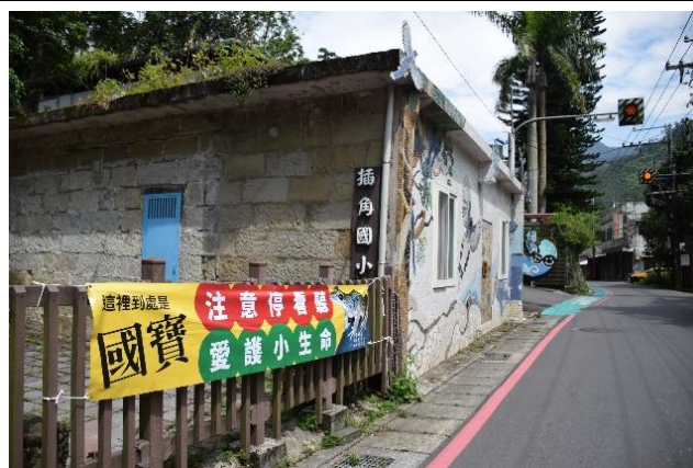
說明：製作護蛙宣導布條，保護青蛙。