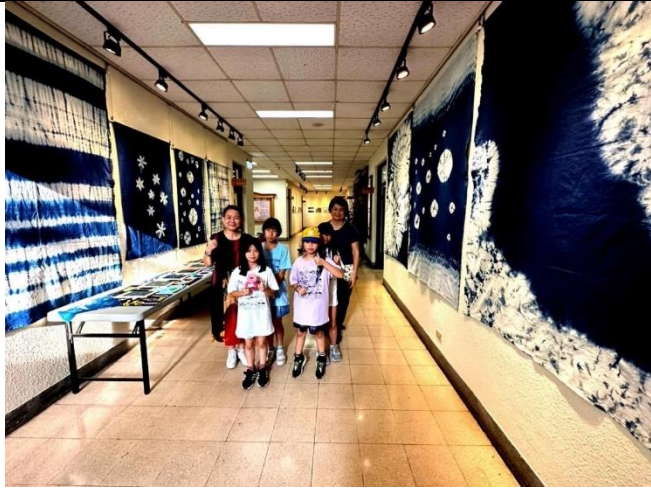
說明：結合生態藝術藍染作品於區公所展出