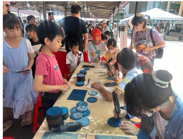
說明：結合生態人文藍晒創客體驗展攤交流