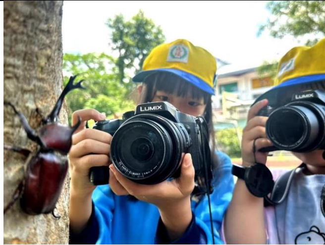
說明：生態攝影觀察學校光蠟樹上獨角仙蹤跡