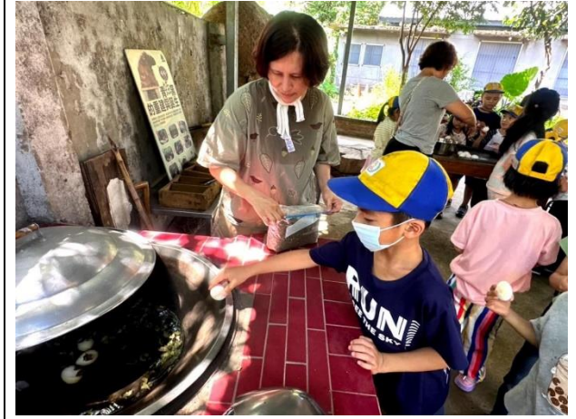
說明：古早味阿嬤灶煮大葉田香茶葉蛋回味