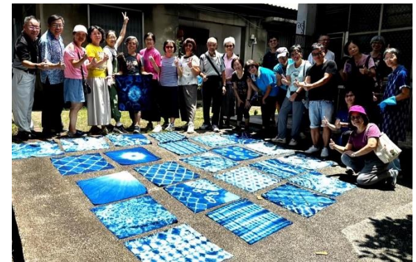
說明：與三峽社大樂齡學員交流藍晒生態