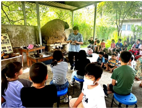
說明：青蛙窯介紹及阿嬤灶煮大菁雞湯