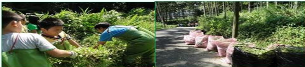
環境行動_清除「綠癌」小花蔓澤蘭