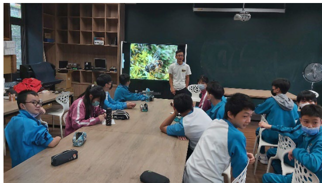
說明：介紹蜜蜂種類