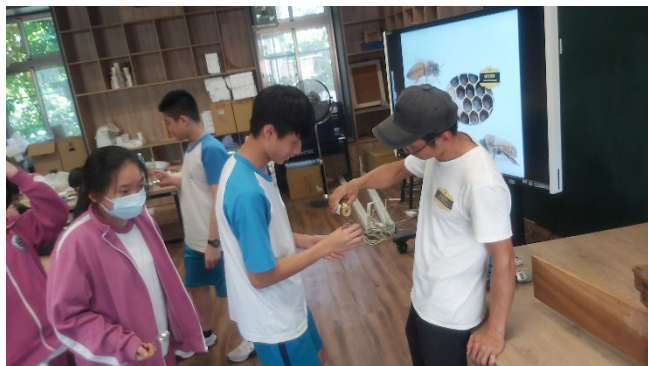
說明：給學生品嚐蜂蜜