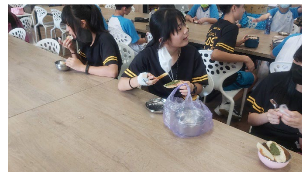
說明：品嚐香草植物料理