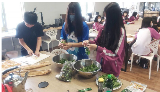
說明：製作香草植物料理