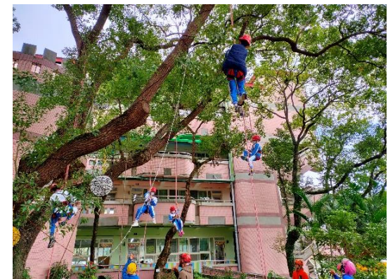
說明：攀樹活動體驗