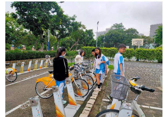
說明：高年級走淨社區活動