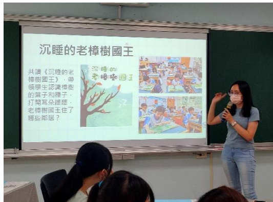
說明：校訂課程實施成果分享