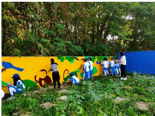
說明：圍牆彩繪活動