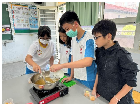
說明：母親節甜點製作