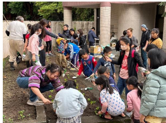
說明：城市小農夫體驗活動