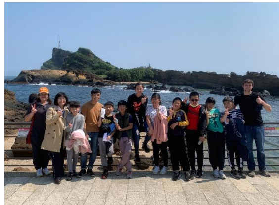
師生在野柳單面山前合影