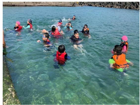
學生海泳自救練習