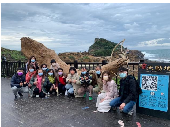
老師野柳地質探索-鯨天動地