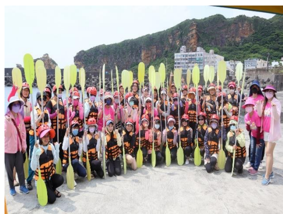
全體老師體驗前合影