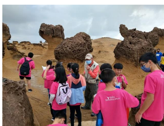
野柳地質公園解說導覽