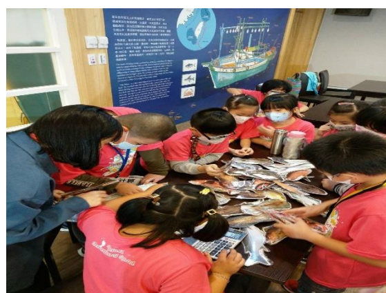
分辨海鮮選擇紅綠燈