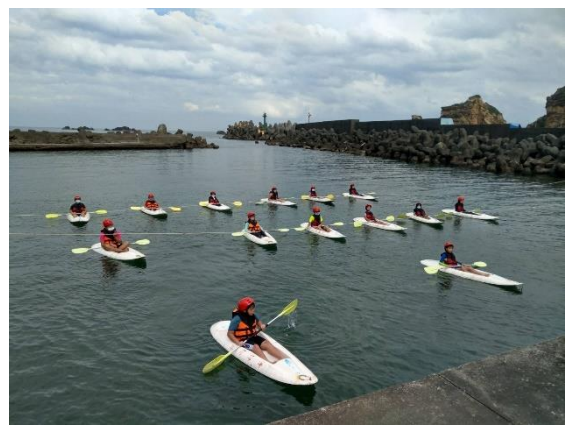
學生獨木舟體驗-練習隊形排列