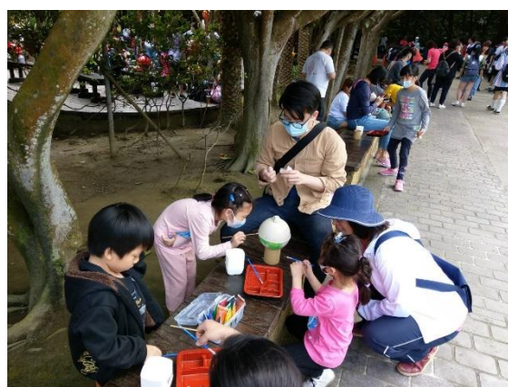
學生創意彩繪浮球