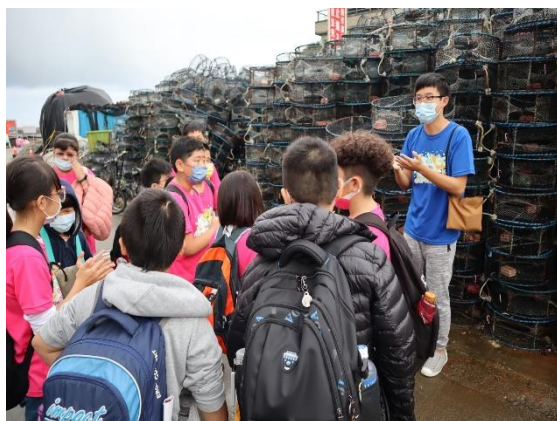
學生走讀野柳社區