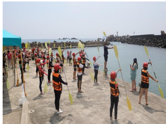
老師操槳基本練習