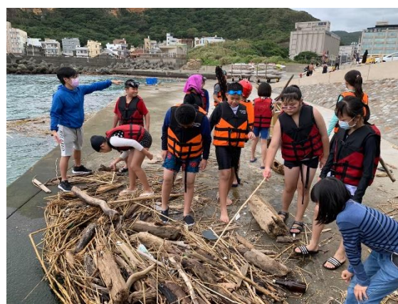
協助清理海王星碼頭漂流木