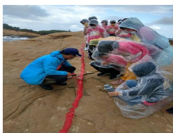
地質景觀塗上紅線之差異侵蝕