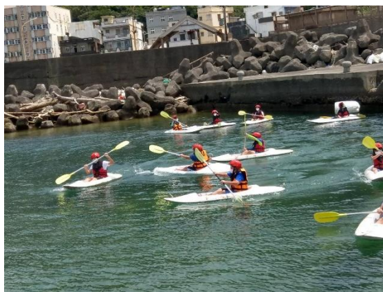
學生獨木舟體驗-練習基本操作