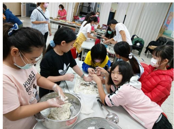
特色海食麵疙瘩製作