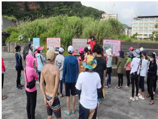
介紹野柳在地海洋水文知識