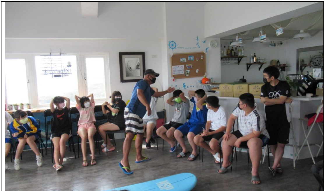
衝浪體驗－衝浪教練教授浪板使用方法與水上安全