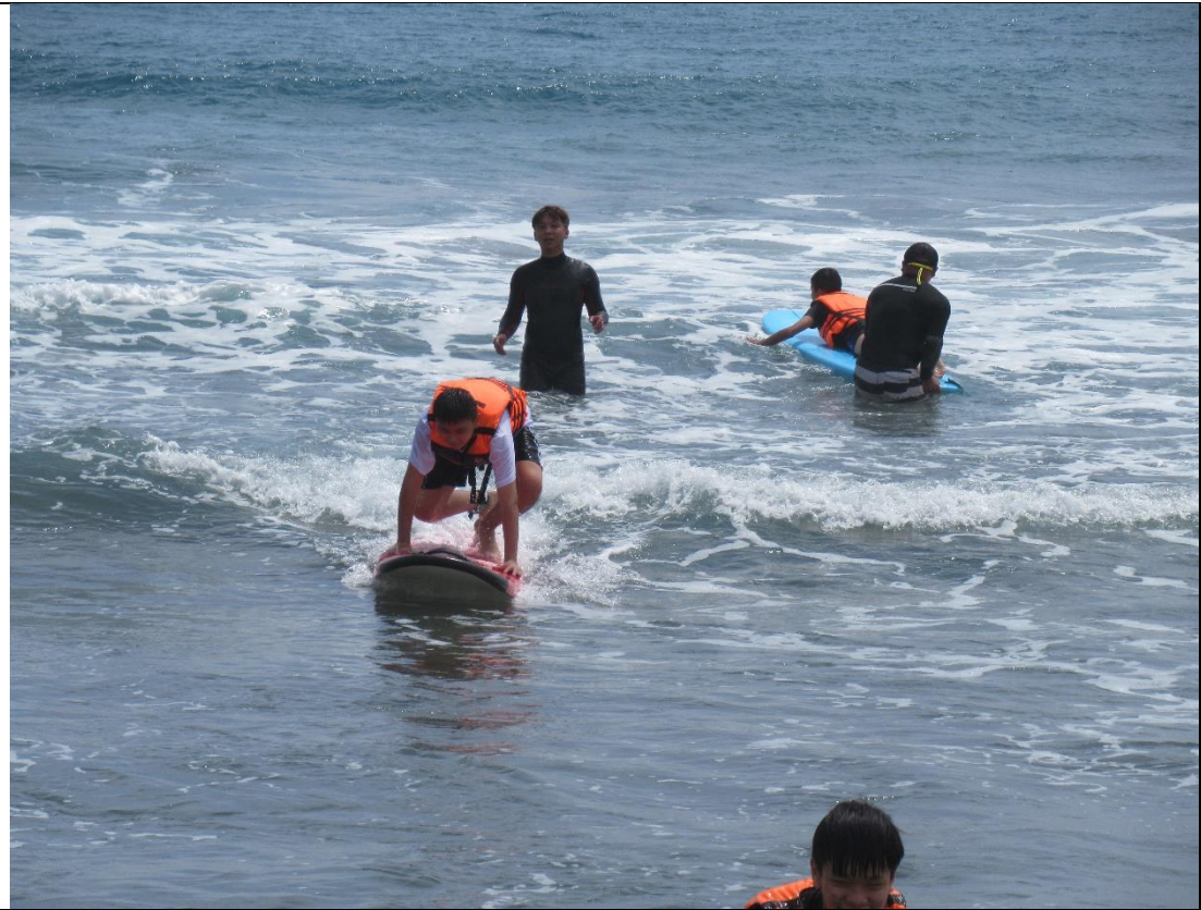
衝浪教練一對一教學