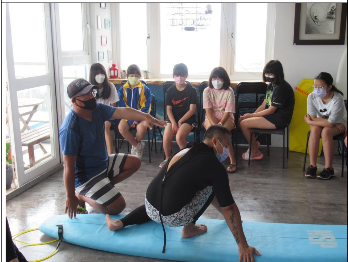
教練示範如何站上衝浪板