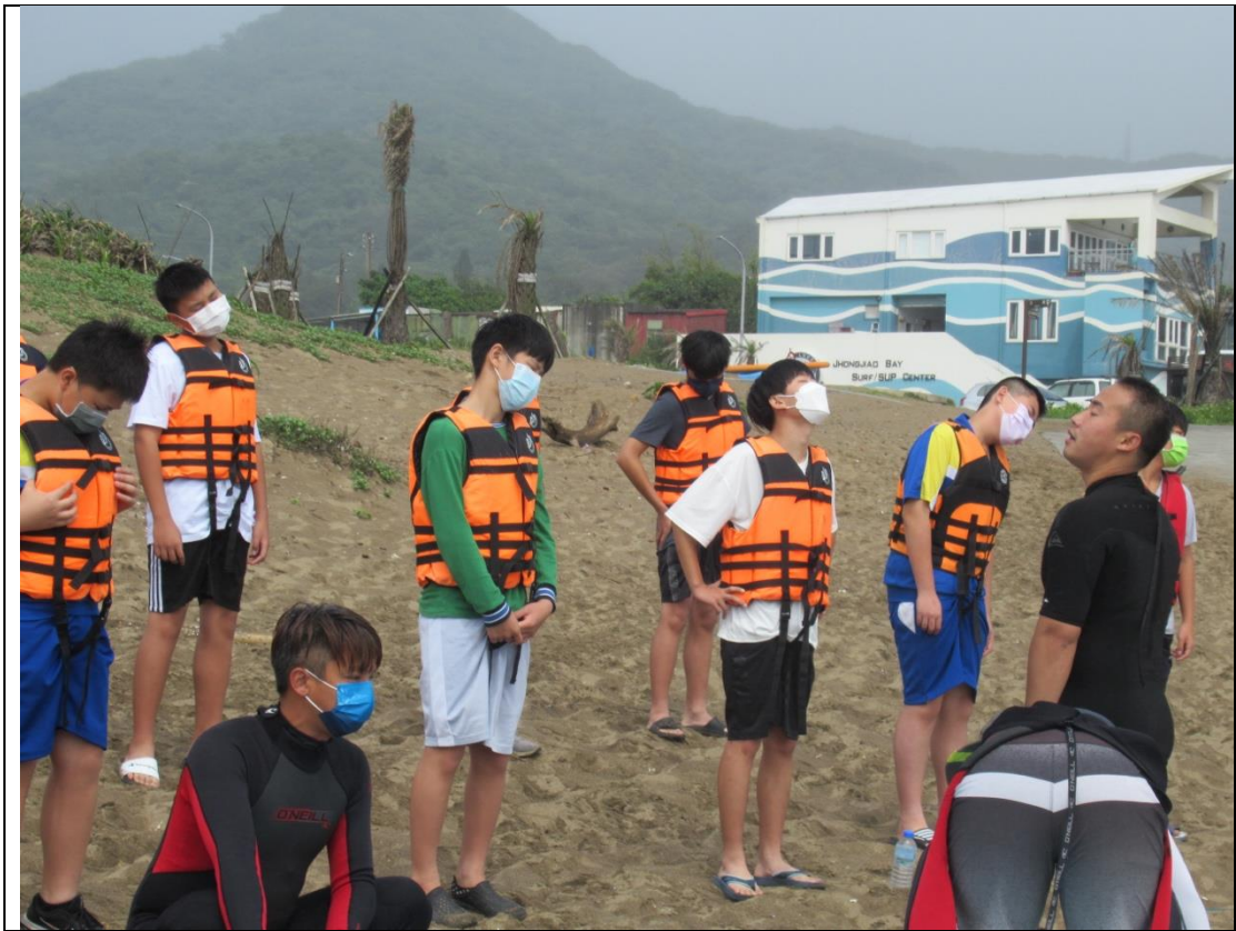
下水前的叮嚀與暖身