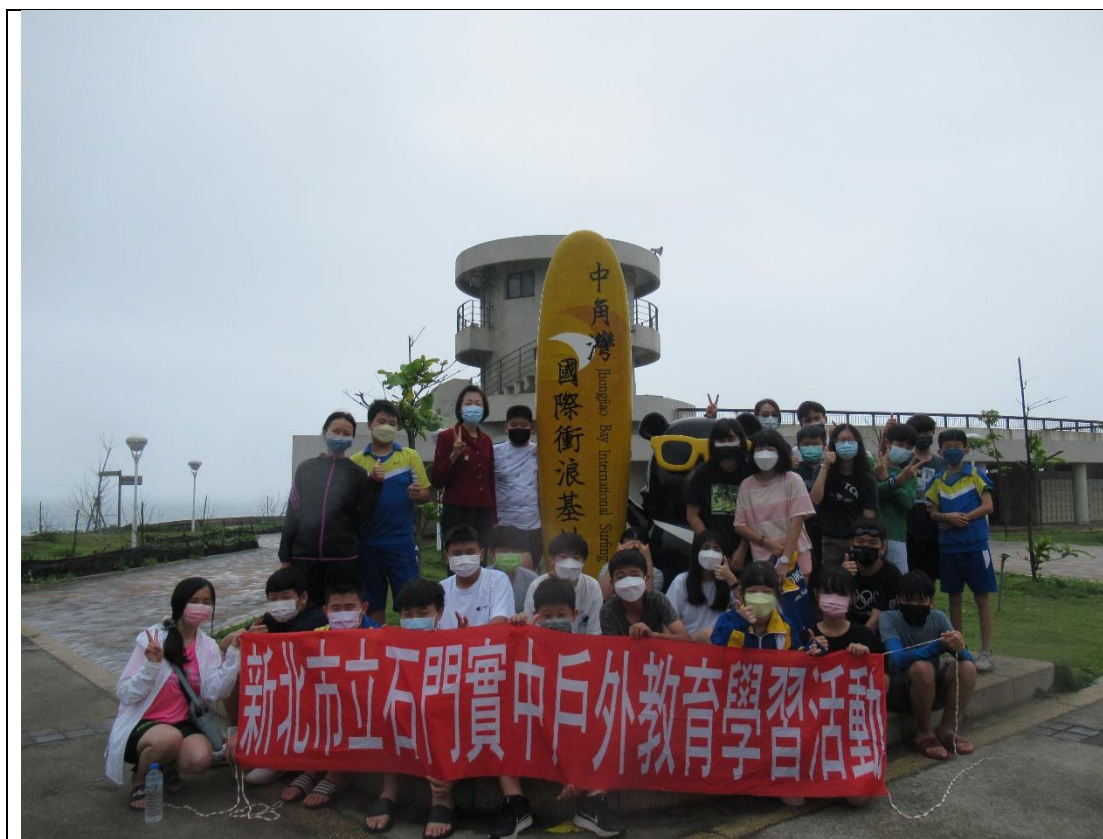
衝浪體驗活動是石門實中實驗教育「浪漫海洋情」的課程之一