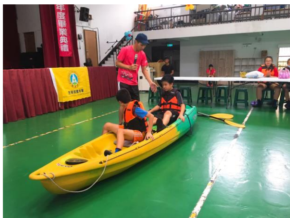
獨木舟介紹、上下船教學