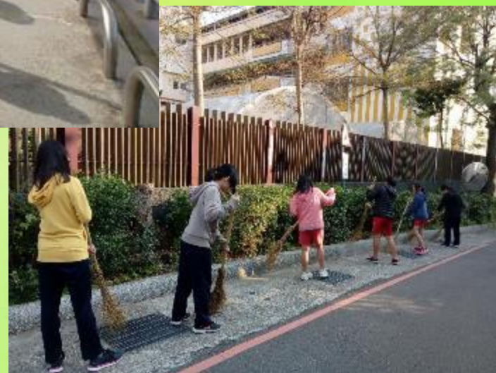
六年級打掃鄰近社區