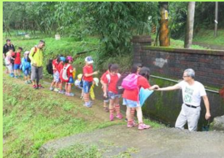
參訪石門區阿里磅農場