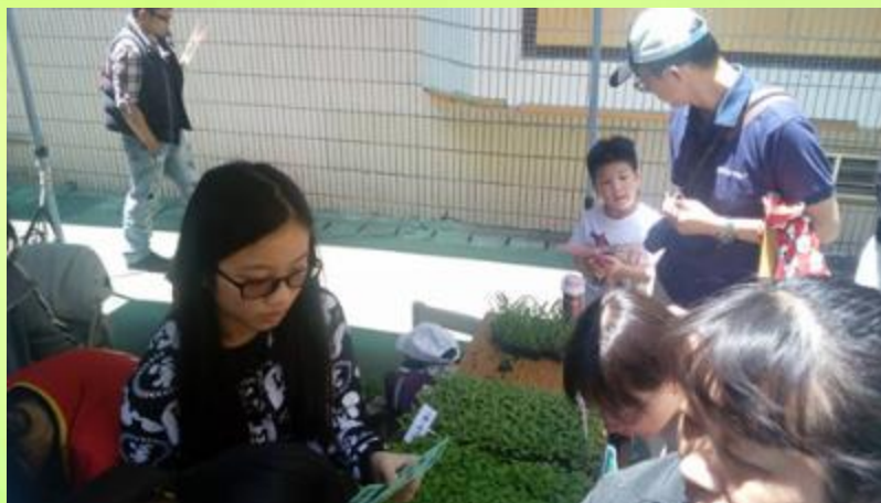
親師生每人認養復育一棵野百合