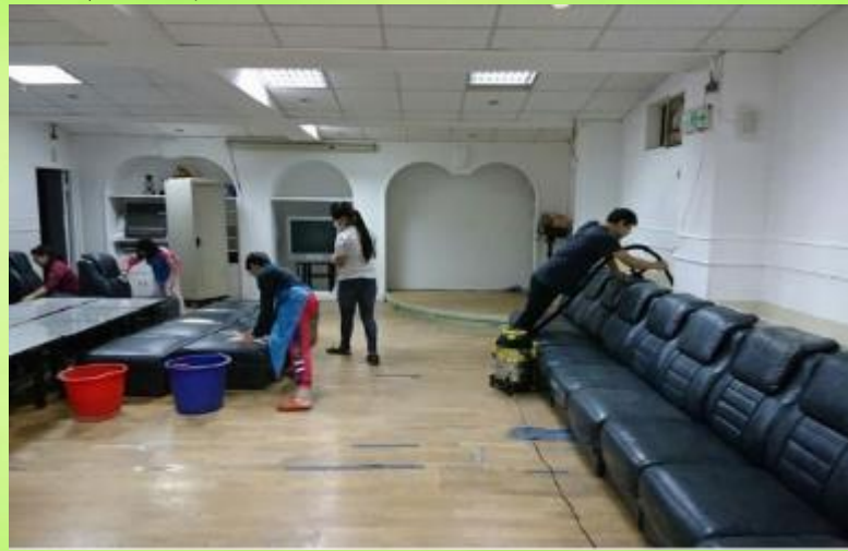
家長會協助整理地下室環境