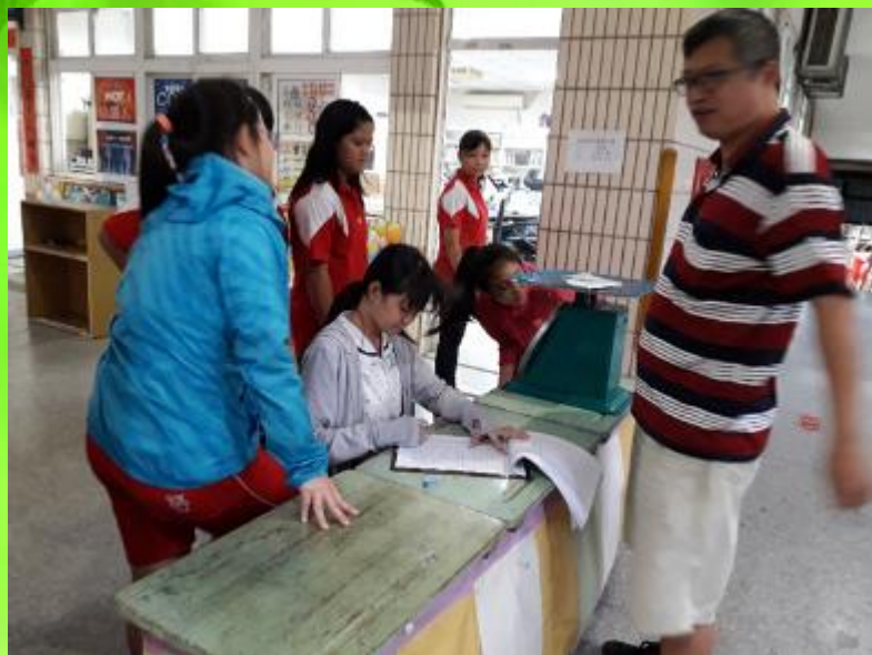
環保小局長廢電池光碟片親師生齊回收