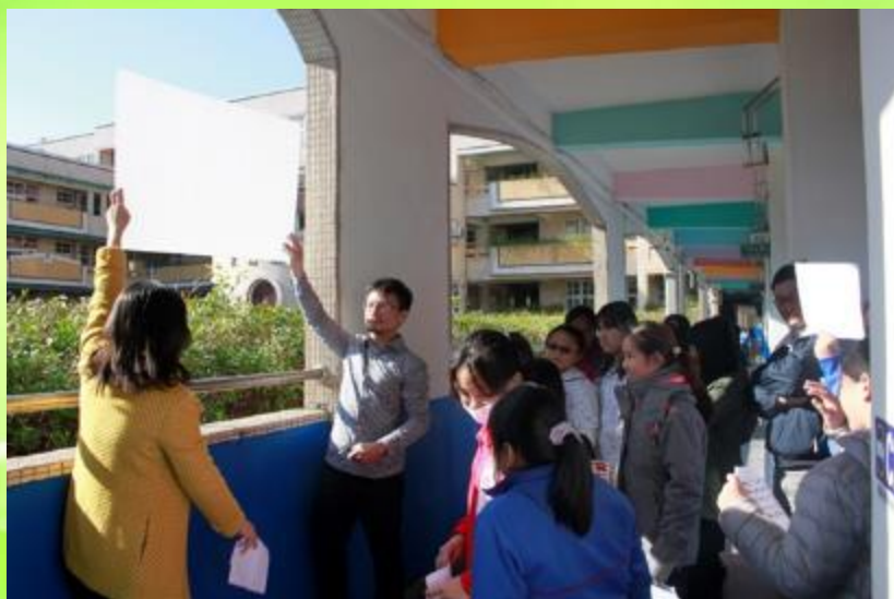
建築師說明外遮陽原理