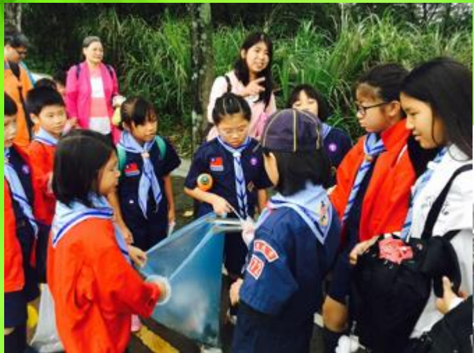
幼童軍社區民眾掃街活動