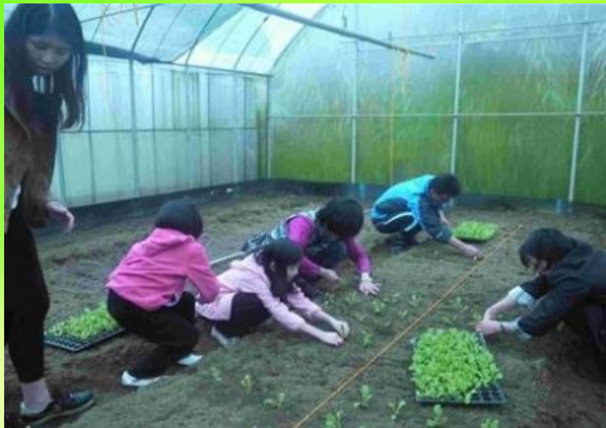
畦遊記農場主人教學耕種