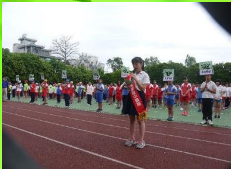
環保小局長帶領親師生進行 「節能減碳六大宣言」宣誓