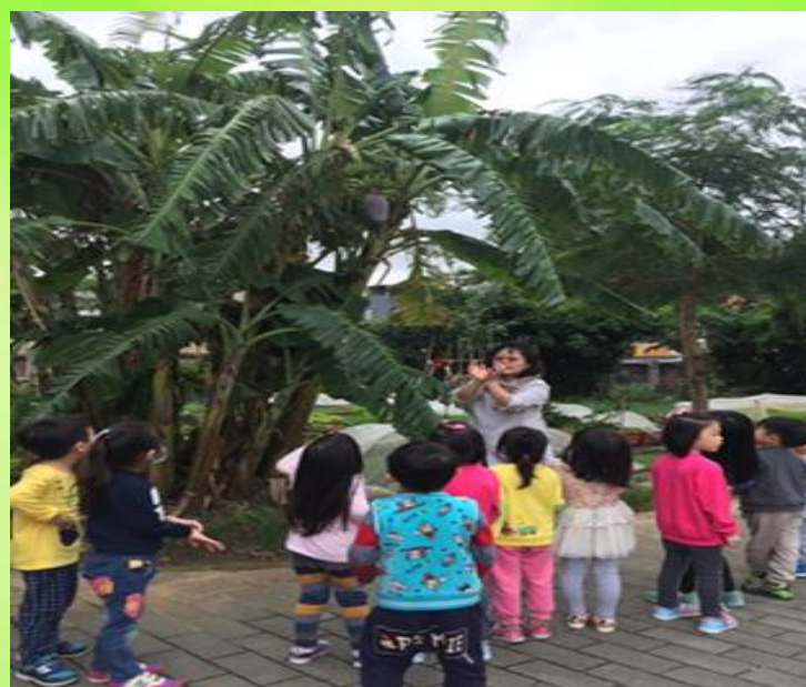
幼兒園食農教育課