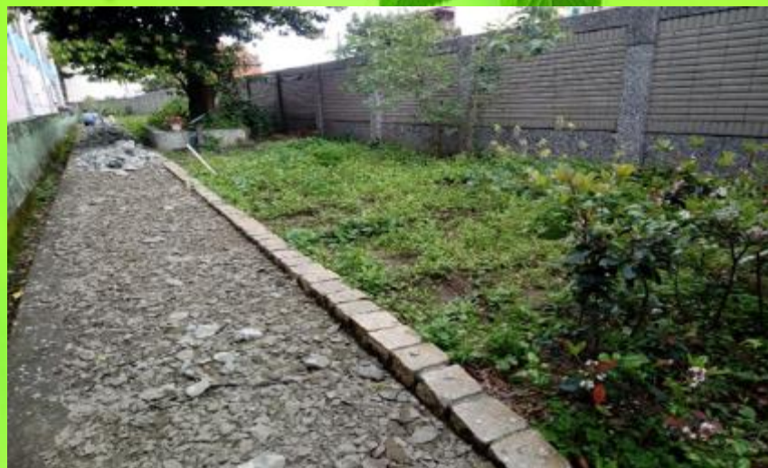
透水鋪面工程進行中