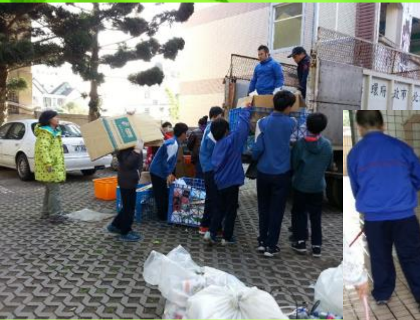
清潔隊校內資源回收