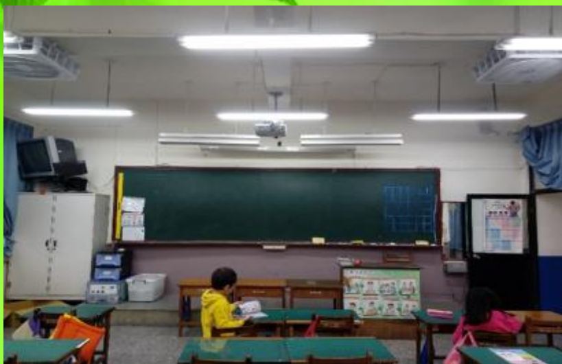
率先參與ESPC專案達節能59%