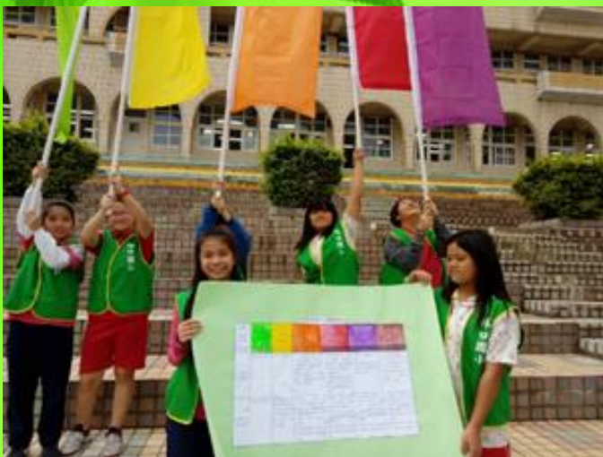
兒童朝會宣導空污旗幟