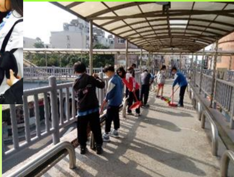
校外天橋打掃服務