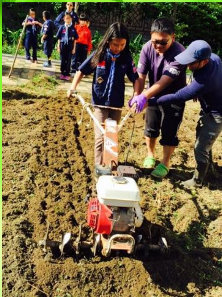
畦遊記有機農場主人教導幼童軍師生耕耘播種