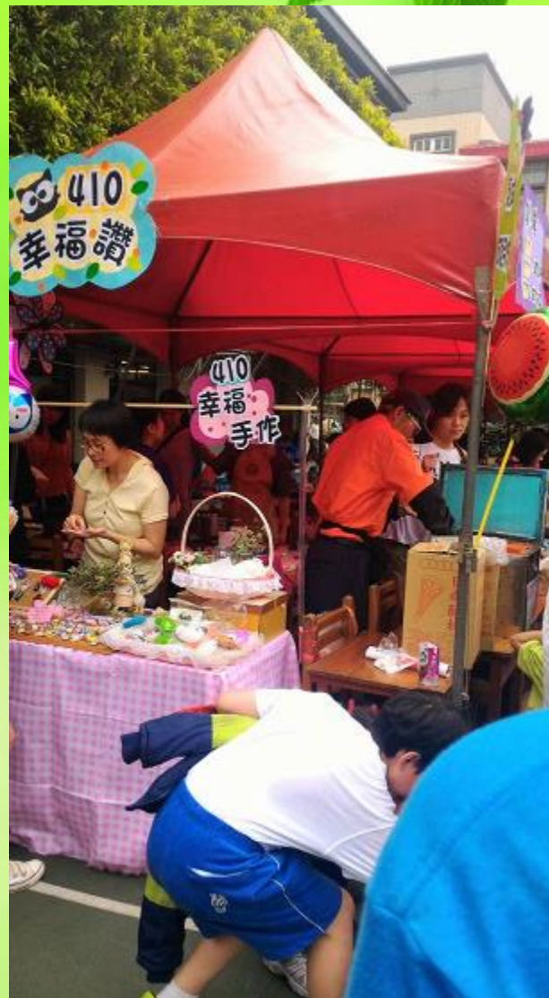
園遊會自備環保餐具提袋