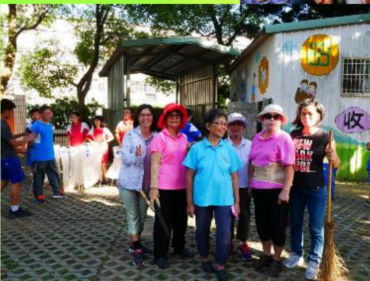
社區志工協助學生資源回收