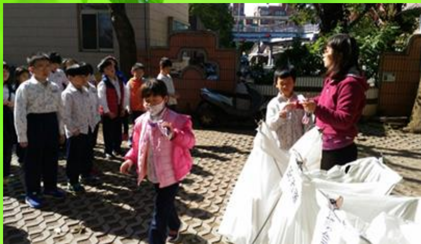
資源回收融入生活課