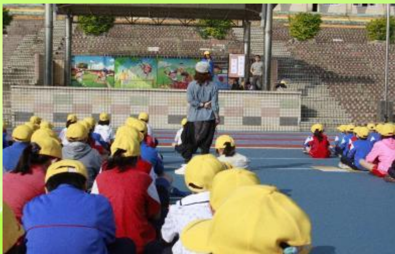
宣導走路上學 節能減碳