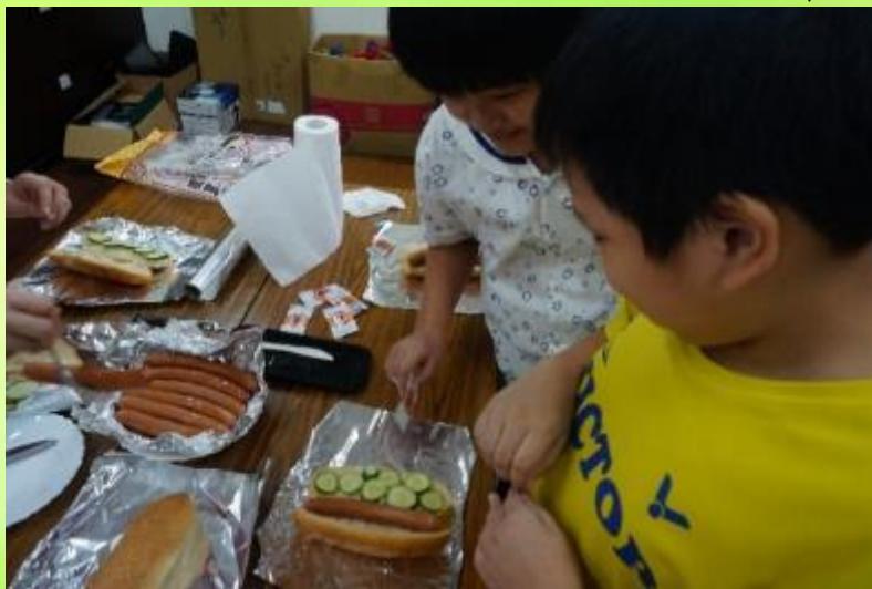
美味早餐 幸福來上學