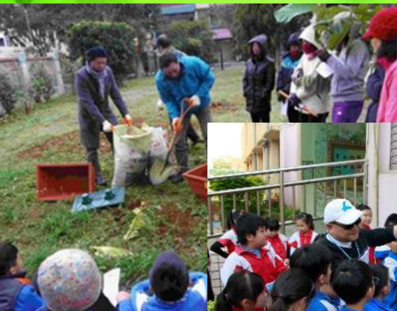
家長志工農作教學