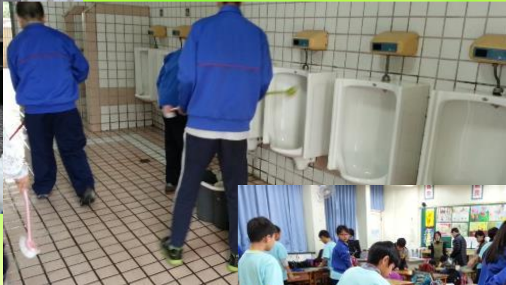
五年級生清掃廁所