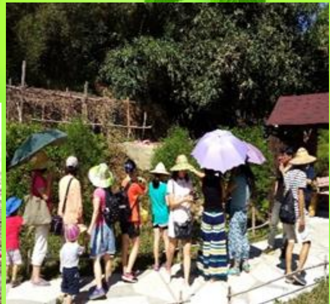
有機茶園生態導覽