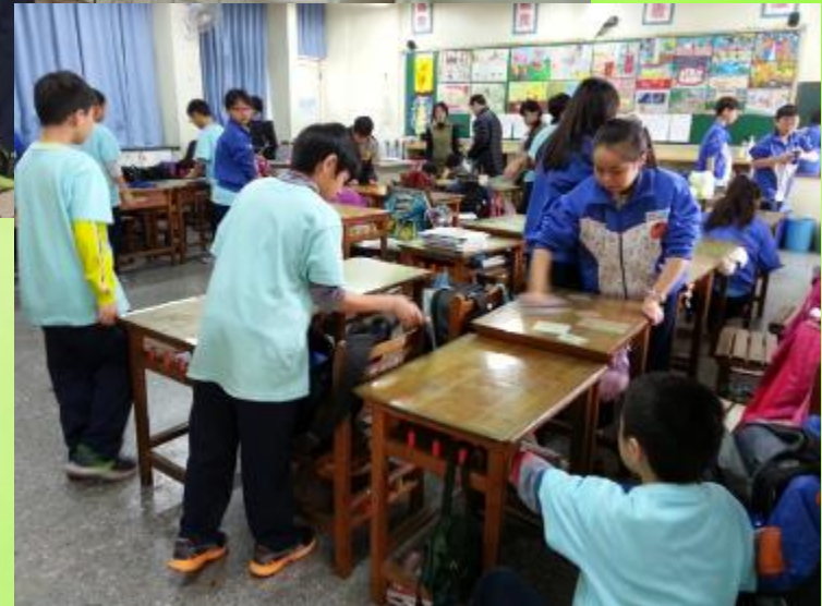
晨光全校性進行消毒工作