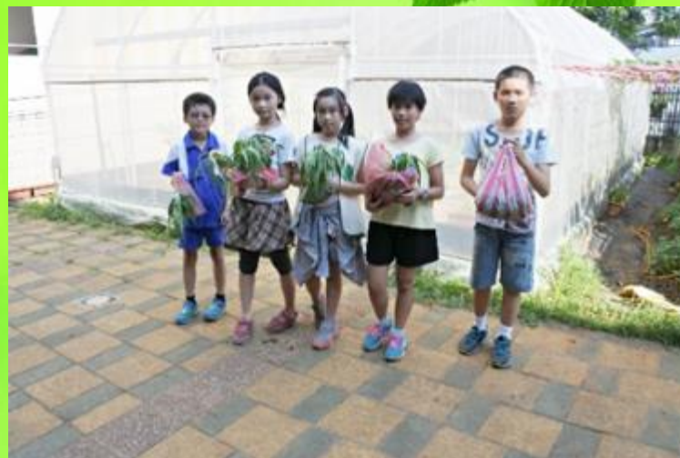
農會四健會老師教導師生播種