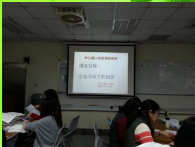
空氣污染下的自保