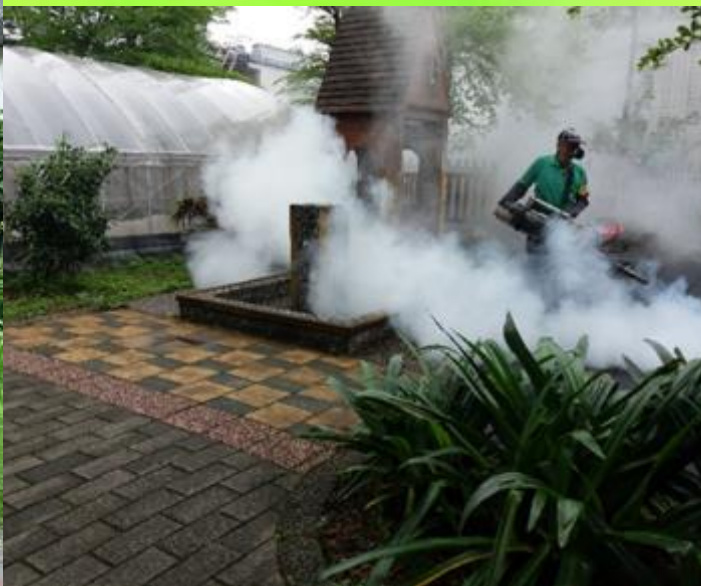
環保局廠商消毒工作