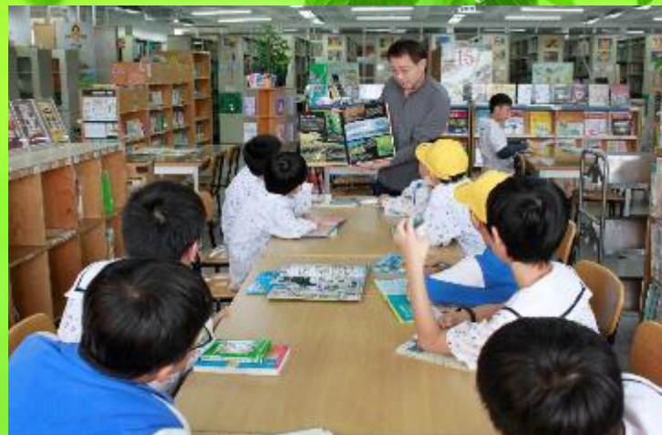
環境教育議題導讀(閱讀課)