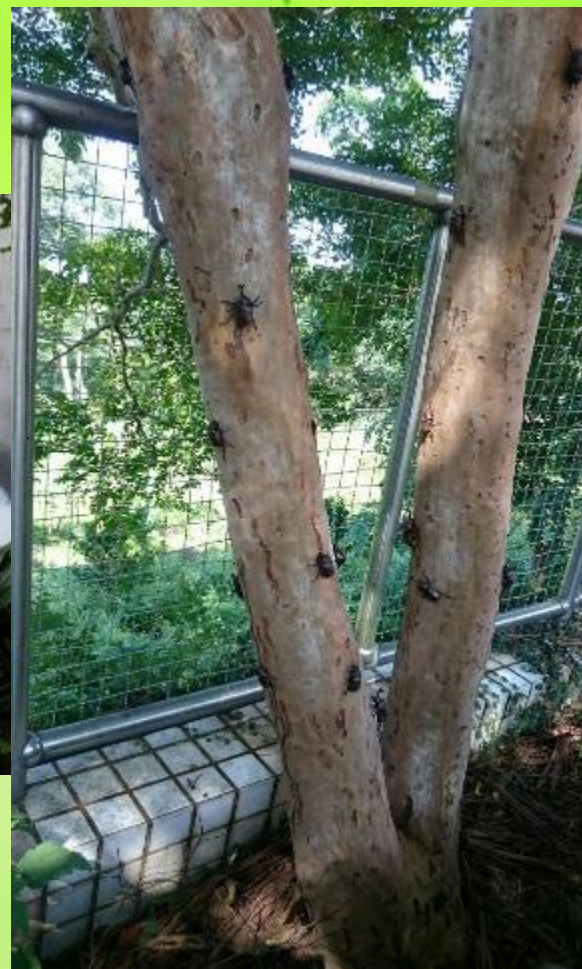
復育成功的獨角仙