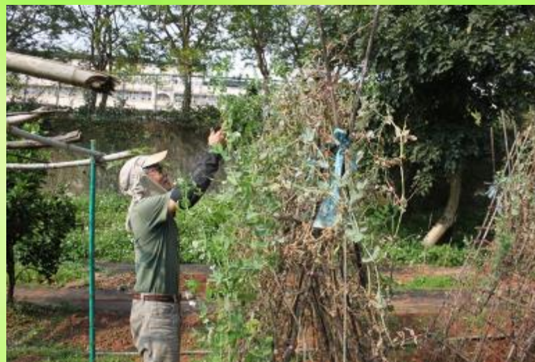
荒地有情天-社區耆老、退休教師勤耕耘