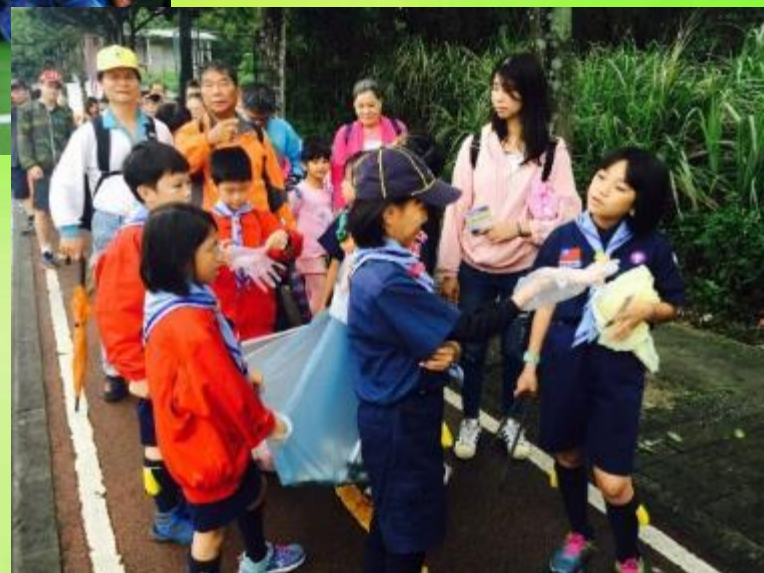
親師生與社區民眾淨街活動