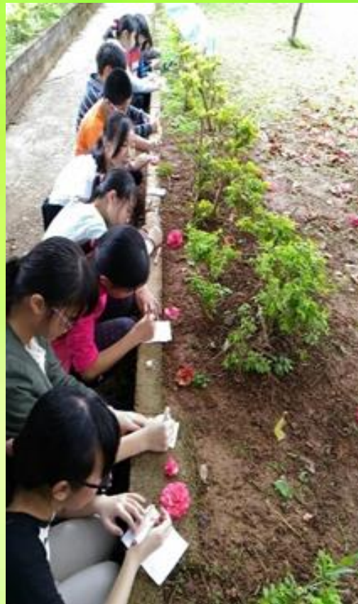
竹林寺環境教育寫生