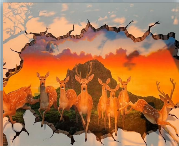
3D 立體生態繪圖牆 展現墾丁保育特色