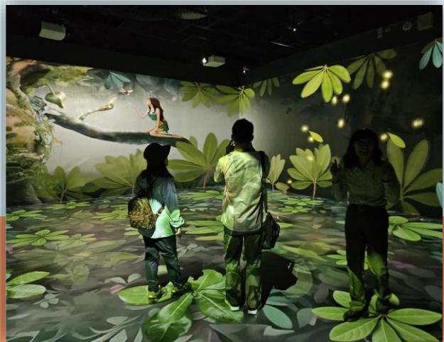
沉浸式劇場環景體驗 感受墾丁夢遊仙境

原有視聽室則轉型為親子多功能區，設置互動背景磁性展牆，讓孩子在遊戲中學習不同棲地與生物知識。全新打造的景觀休憩平台，結合生態藝術造景與 3D 立體生態繪圖牆，成為遠眺貓鼻頭與夕陽海景的絕佳打卡新亮點。