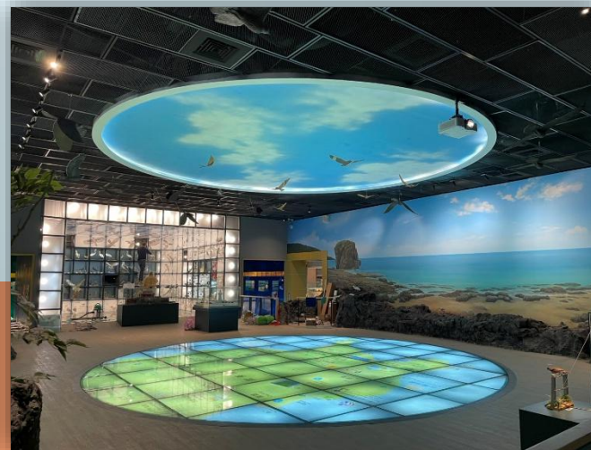
天地地圖營造空間情境 悠遊墾丁遊憩資源與地景脈絡