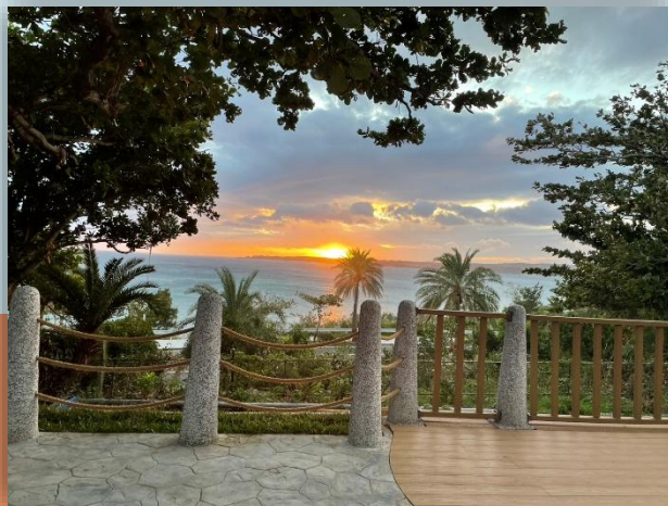
景觀休憩平台遠眺貓鼻頭與 夕陽海景