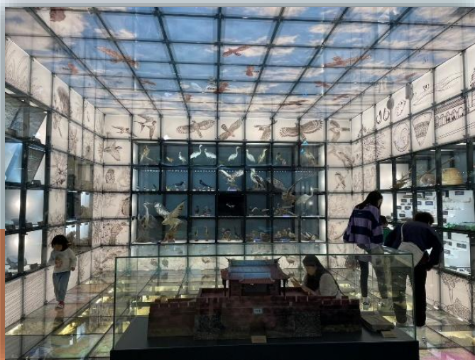
如同生態精品櫥窗的 「空間寶盒」