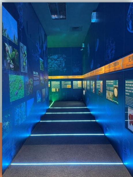
時光通道帶領遊客 穿越人文歲月

展示手法導入AR、VR 及沉浸式體驗等新型態科技，並充分活用既有標本、模型與文物，讓遊客能以更直觀、更立體的方式，感受墾丁的熱帶山海景觀、生物多樣性與在地環境文化，展現兼具互動性、教育性與親子共融的永續新風貌。