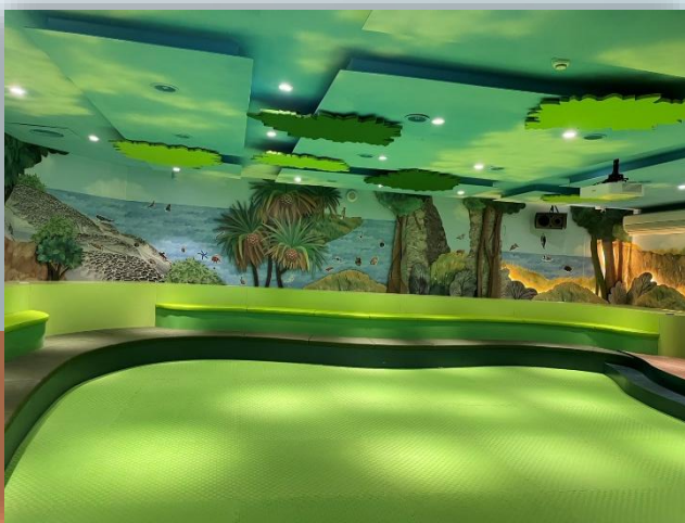
親子空間讓孩子在遊戲中 學習生物與環境的關係