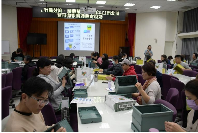
桃改場樹林分場李助理研究員婷婷教授學員如何使用折疊箱種植植物