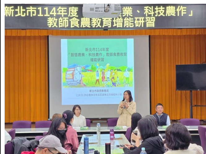
教育局衛生保健及環境教育科連專員英絮致詞