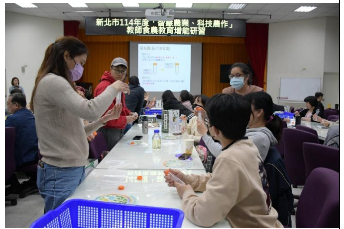
學員們認真學習製作葵無露