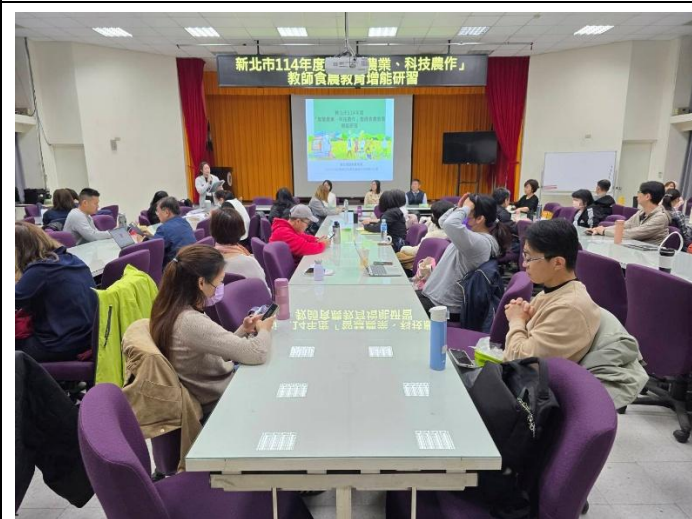
教師增能研習活動現場狀況