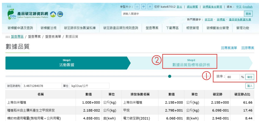
圖 24、米之情境 1-產品碳足跡資訊網步驟 7