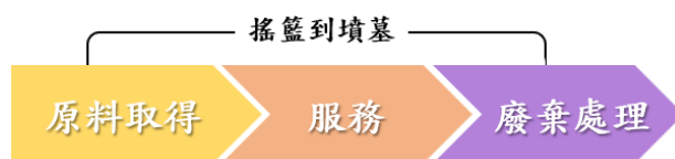
圖 5、服務系統界限設定建議