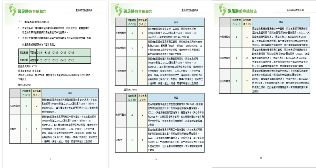
圖 16、鋼筋-步驟 9 整體數據品質評核結果匯出