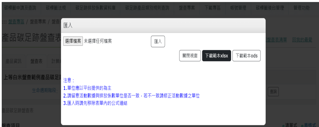
圖 41、米之情境3-產品碳足跡資訊網步驟4