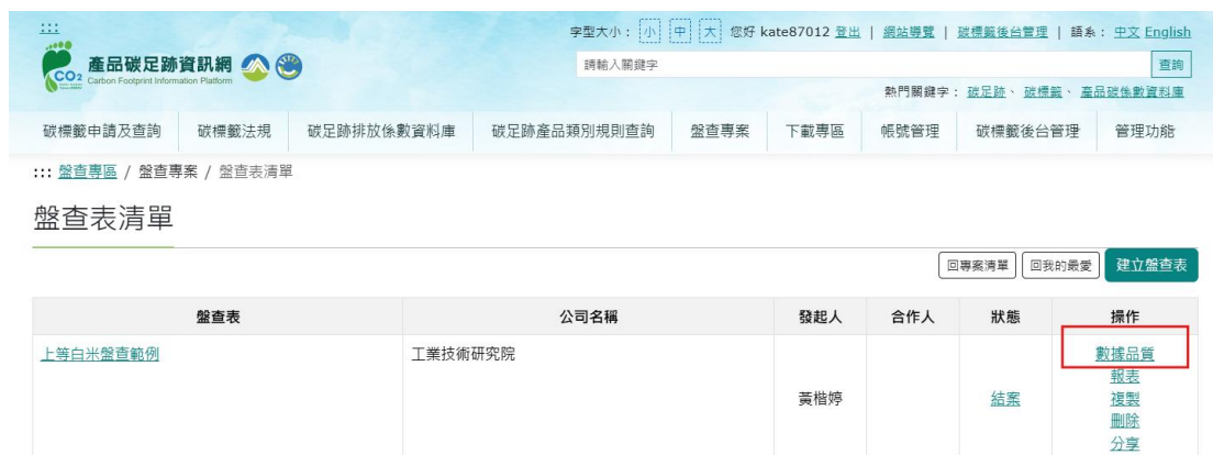
圖 23、米之情境 1-產品碳足跡資訊網步驟 6