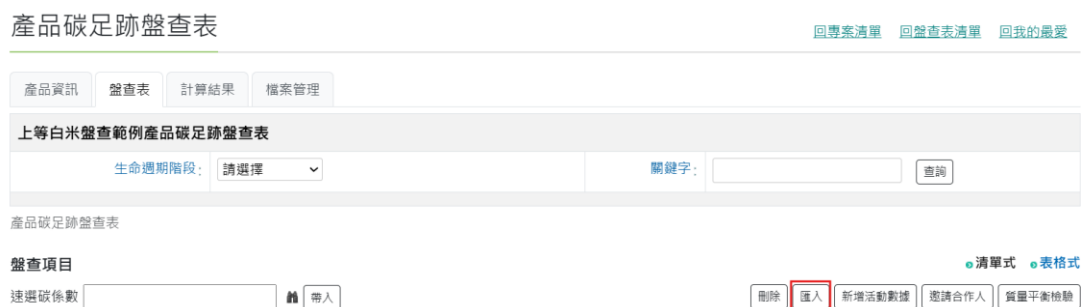
圖 20、米之情境 1-產品碳足跡資訊網步驟 4