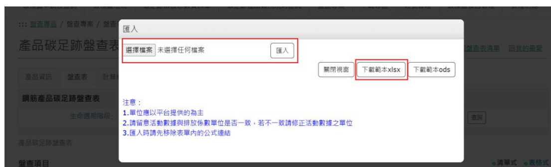
圖 11、鋼筋-產品碳足跡資訊網步驟 4