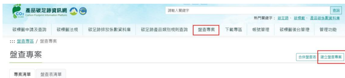
圖 28、米之情境 2-產品碳足跡資訊網步驟 2

(九) 步驟 9：切換至「盤查表清單」分頁，於「操作」欄位點選「數據品質」，進行數據品質評核→於「操作」欄位，可點選「報表」匯出數據品質評核結果（如圖 36）。