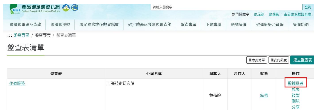
圖 54、旅館住宿服務-產品碳足跡資訊網步驟 6