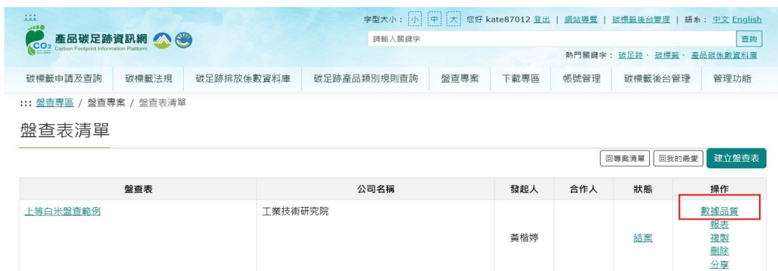
圖 33、米之情境2-產品碳足跡資訊網步驟 6