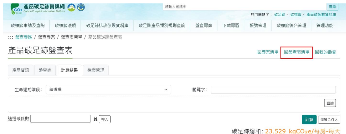
圖 53、旅館住宿服務-產品碳足跡資訊網步驟 5