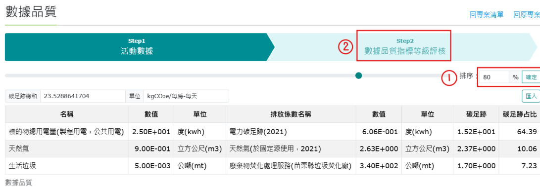
圖 55、旅館住宿服務-產品碳足跡資訊網步驟 7