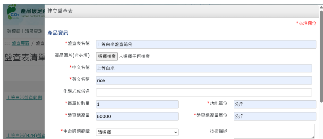
圖 19、米之情境 1-產品碳足跡資訊網步驟 3