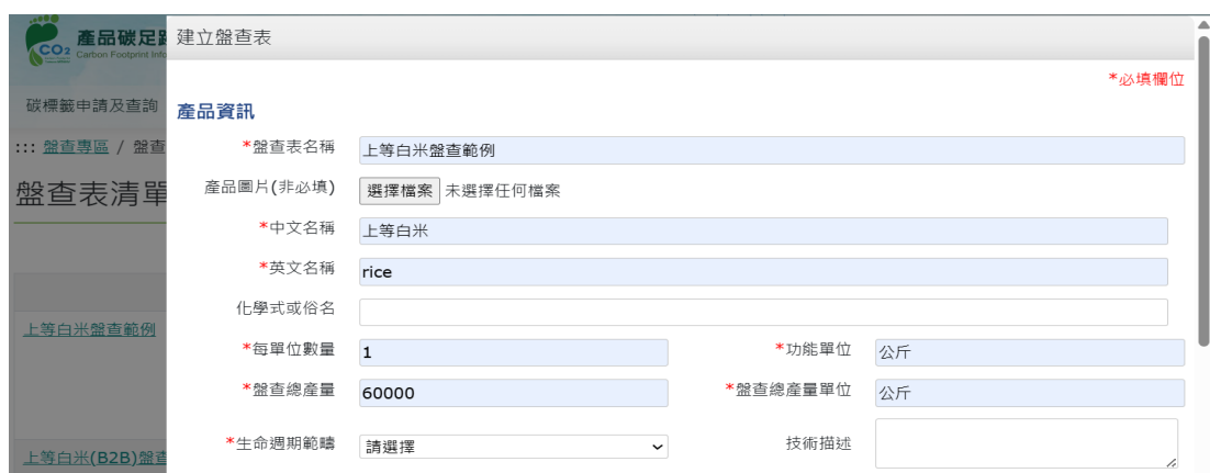
圖 39、米之情境 3-產品碳足跡資訊網步驟 3