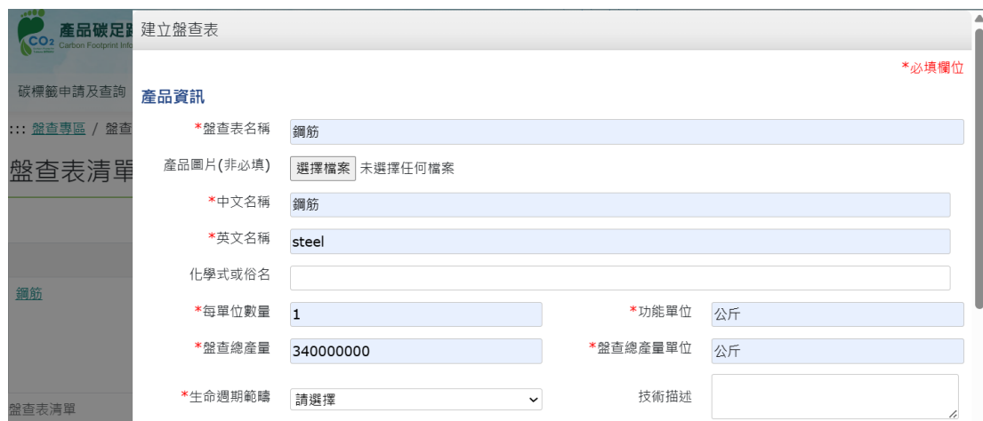
圖 9、鋼筋-產品碳足跡資訊網步驟 3