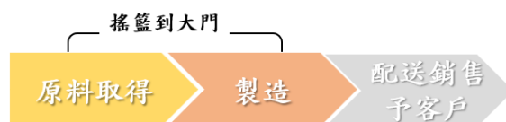
圖 3、中間產品系統界限設定建議