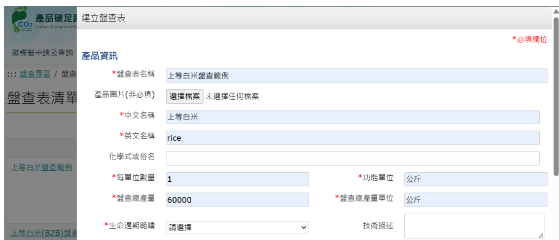
圖 29、米之情境 2-產品碳足跡資訊網步驟 3