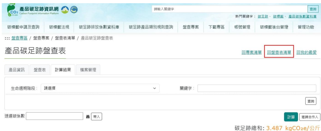
圖 42、米之情境3-產品碳足跡資訊網步驟5