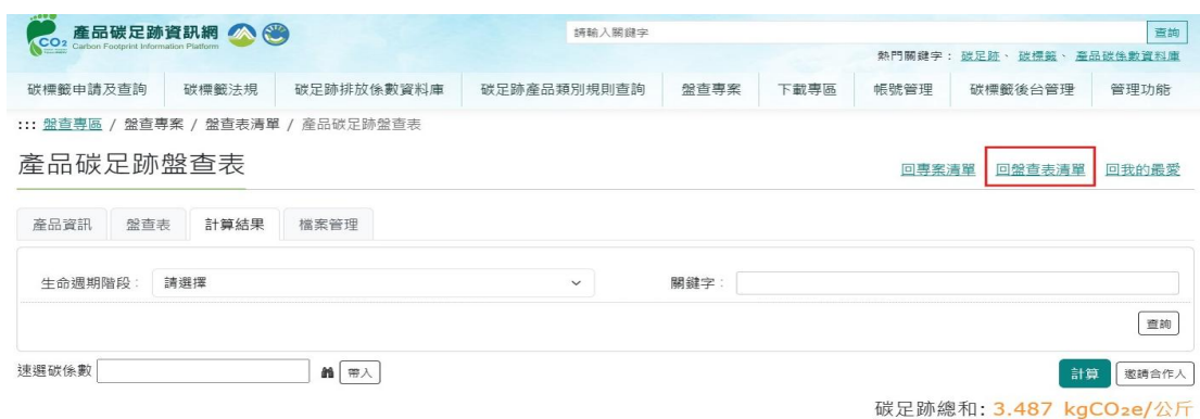
圖 32、米之情境2-產品碳足跡資訊網步驟 5