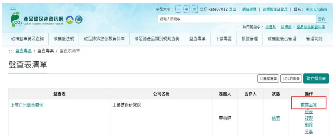
圖 43、米之情境3-產品碳足跡資訊網步驟6