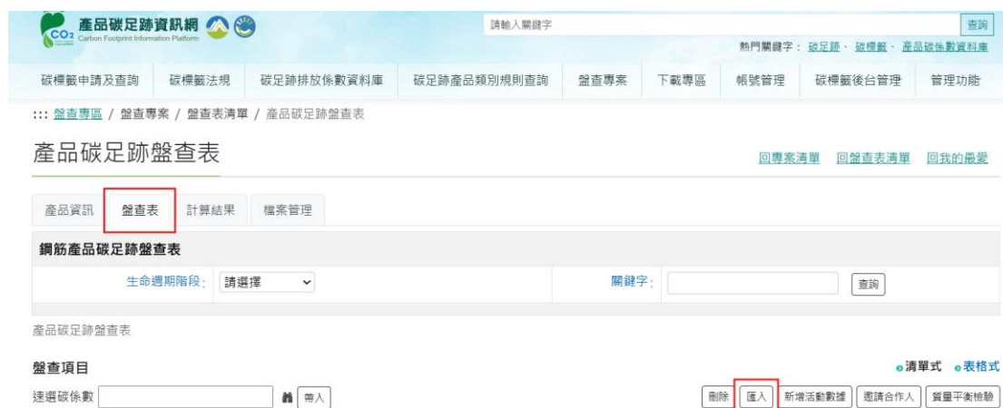
圖 10、鋼筋-產品碳足跡資訊網步驟 4