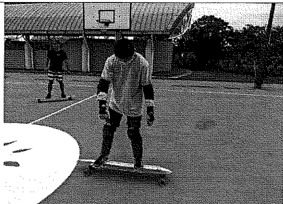
學生至中角國小練習場進行衝浪活動