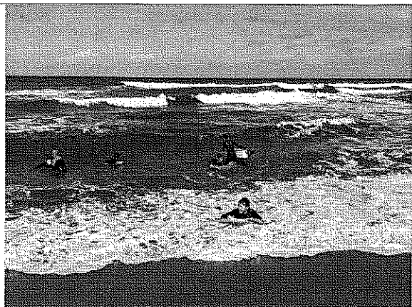
學生至中角灣進行衝浪活動