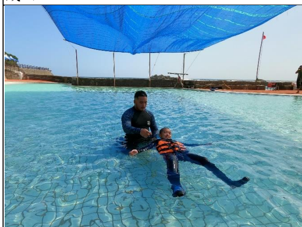
活動說明：漂浮自救教導