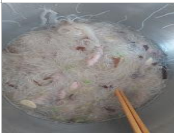
活動說明：品嚐當季當令漁村食物-小卷米粉