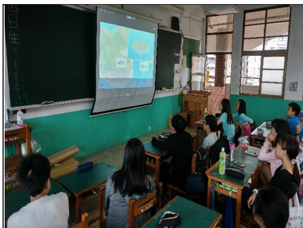
活動說明：在課堂上介紹灣澳與岬角地形的成因