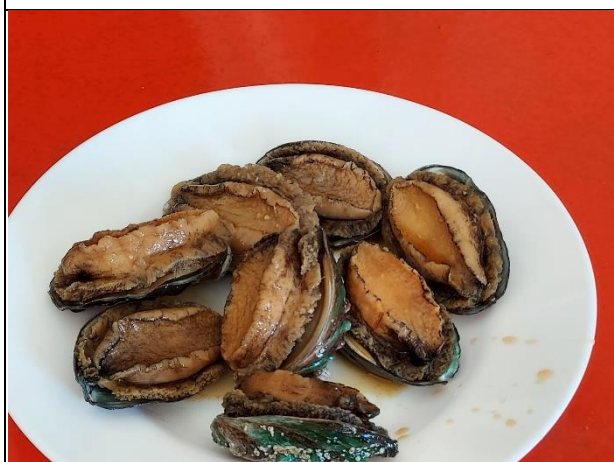
活動說明：品嚐當季當令漁村食物-九孔鮑