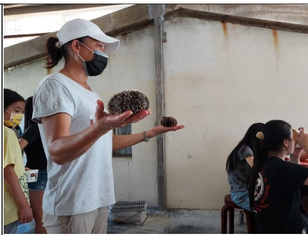
活動說明：解說海膽