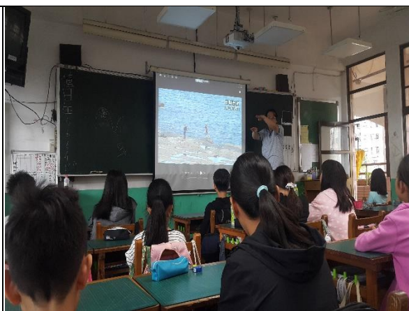
活動說明：萊萊海岸地形成因說明