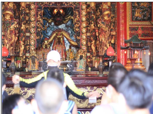
活動說明：認識漁村的鄉土文化與宗教信仰