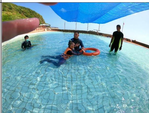
活動說明：教導輔助救生圈協助下海觀察